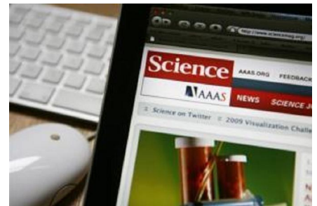
Acheter certains médicaments en ligne pourrait devenir légal.

Ce type d'information ne jouit pas globalement